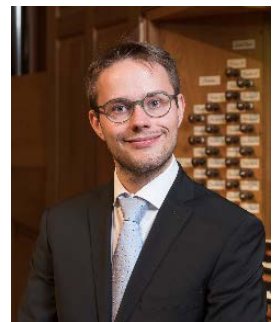
マルタン・グレゴリウス

■出演 チェンバロ/マルタン・グレゴリウス(第 19 代札幌コンサートホール専属オルガニスト)