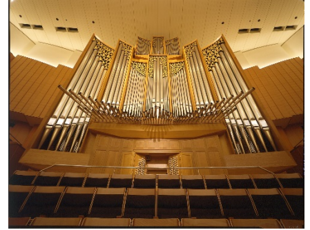
パイプオルガン（大ホール）

【申込先】電話:011-520-2000(代) 札幌コンサートホール事業課事業係（10:00～17:00※休館日を除く） ※札幌大谷大学の学生・公開講座にお申込みの方は大学へお問い合わせください。