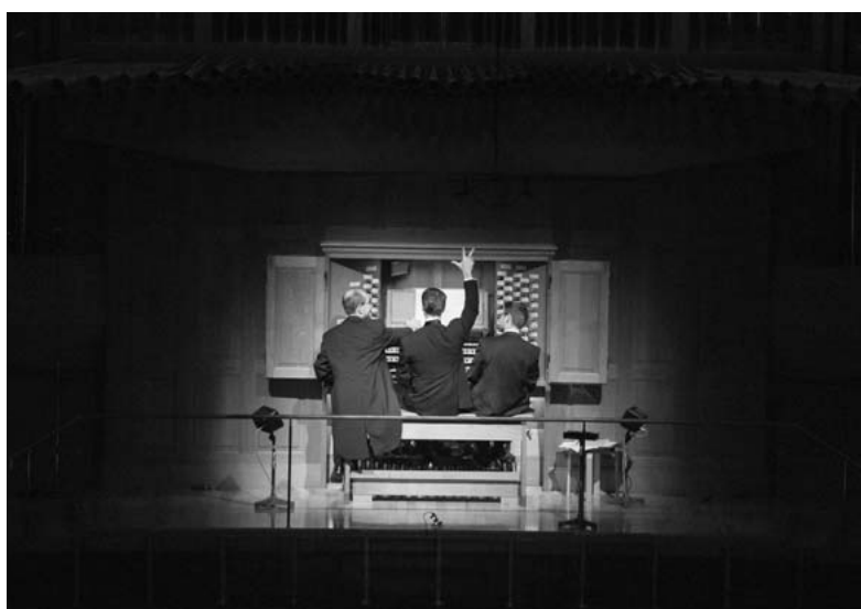
開館20周年記念 オルガンガラコンサート 平成29年12月9日（土）