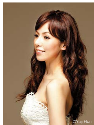
ソプラノ 森 麻季