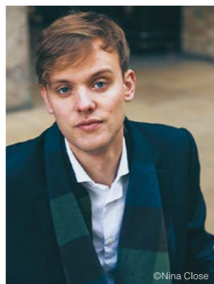
アルト アレクサンダー・チャンス